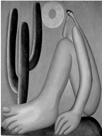
Abaporu – 1928.