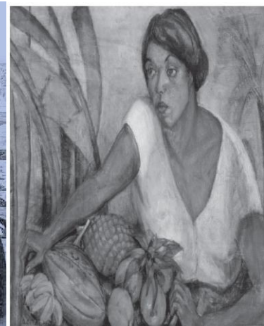
Tropical – 1917.

O item que apresenta seus respectivos autores é